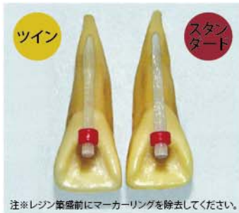
注※レジン築盛前にマーカーリングを除去してください。

ツインルーセントアンカーは優れた光透過性により、金属製ポストに見られる金属色の透過もなく、天然歯に近い自然な色調の審美的補綴が可能です。