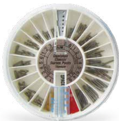
スターリフィルキット

世界の臨床医に高く評価されてるデンタータス スクリューポストは 支台築造および歯冠修復の際の保持力を正確に補強します。